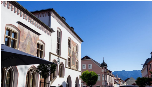
Rathaus Markt Murnau a. Staffelsee